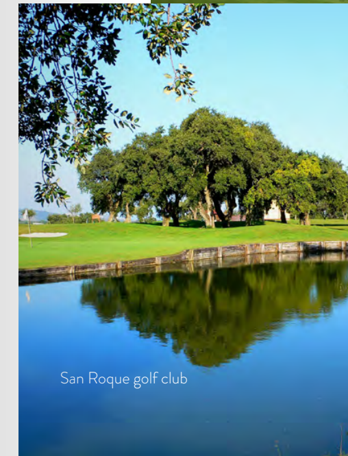
San Roque golf club