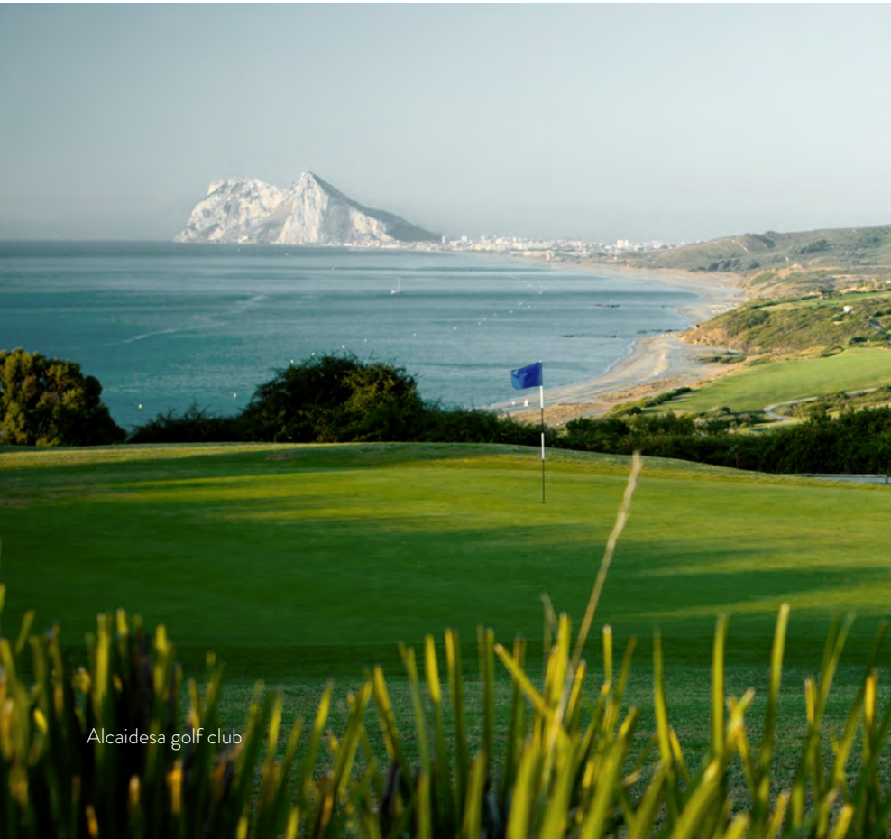
Alcáidesa golf club