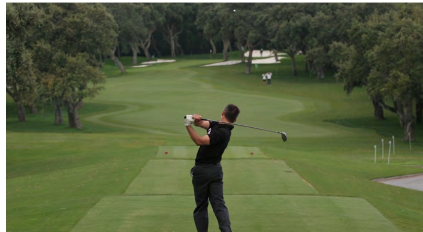
Real club de golf Valderrama