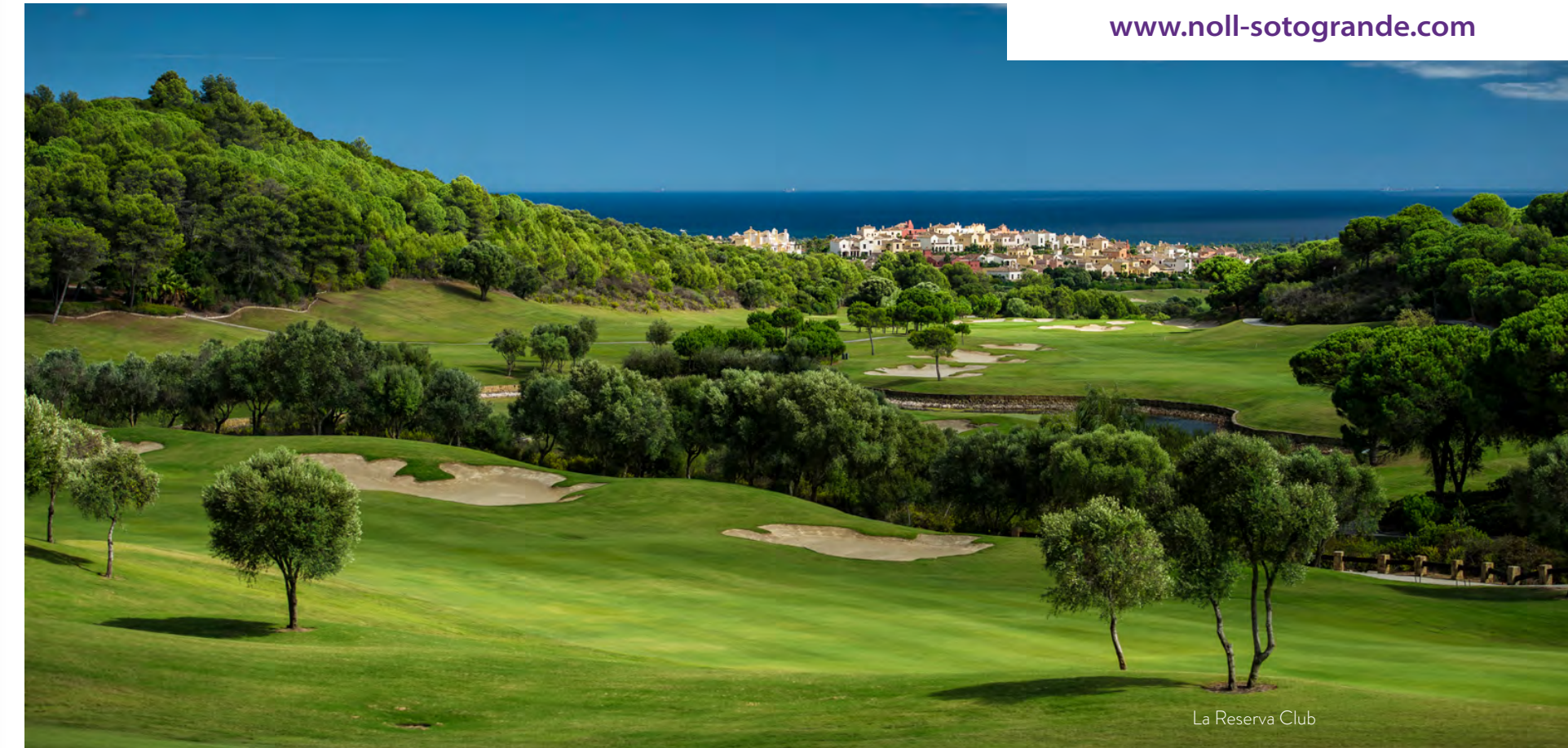
La Reserva Club